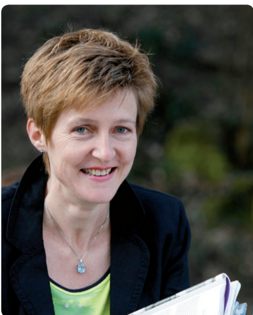
SKS-Präsidentin und Ständerätin Simonetta Sommaruga setzte sich im Parlament erfolgreich für Konsumentenangelegenheiten an.