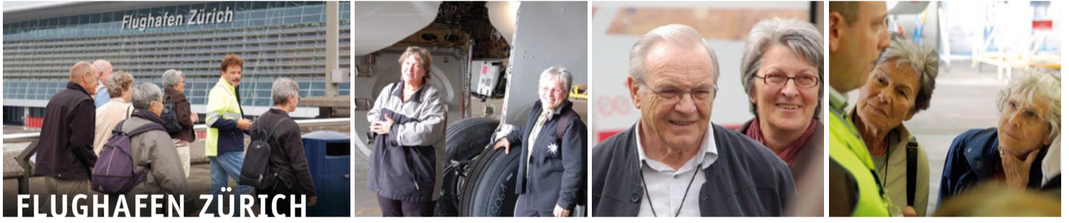
Mit der SKS auf Reisen: Die Gönnerinnen und Gönner besuchten den Flughafen Unique Zürich, die Gotthard Neat-Baustelle und die eindrucksvolle Umer Landschaft.