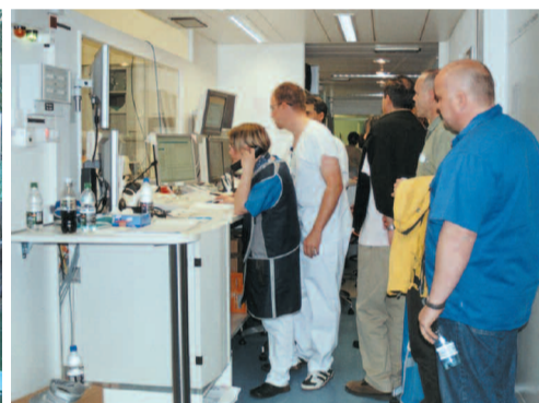
Führung im Inselspital Bern