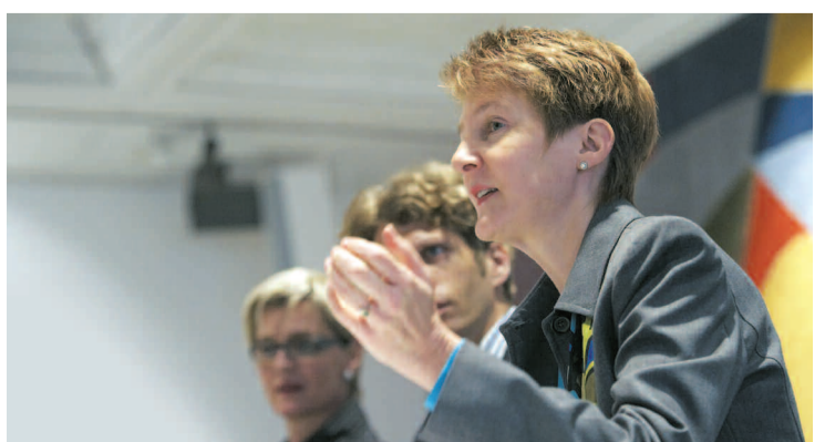
SKS-Präsidentin und Ständerätin Simonetta Sommaruga setzt sich im Parlament vehement für Parallelimporte ein.

Das ist sehr ärgerlich: Ob Velo oder Koffer oder Rasierklingen – diese Produkte sind in der Schweiz 30 Prozent teurer als im umliegenden Ausland. Der Grund: Viele Detailhandelsprodukte sind patentgeschützt und dürfen nicht günstiger parallel importiert werden. Stattdessen hat der Alleinimporteur ein Importmonopol und kann für die Schweiz höhere Preise festlegen. Das wurde vom Bundesgericht so entschieden, der Bundesrat wollte dies nun auch im Patentgesetz festschreiben. Das wollte die SKS nicht durch-