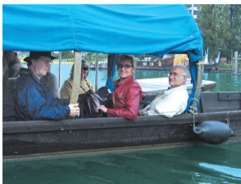
Bootsfahrt im Basler Rheinhafen