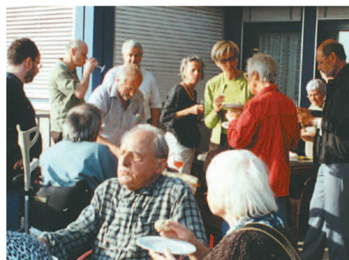
Auf Tuchfühlung mit der SKS

Ein Hauch von weiter Welt und internationaler Schifffahrt: Rund 200 Gönnerinnen und Gönner liessen sich vom Angebot, den Basler Rheinhafen zu besuchen, packen. Neben Informationen oder einem Rundgang durfte eine Bootsfahrt nicht fehlen. Wer die Nase in die richtige Richtung hielt, roch bereits die Nordsee!